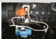
Kit travaso automatico carburante Automatic fuel transfer kit