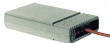
Preriscaldamento Engine preheating system