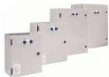
Quadro di commutazione automatica (ATS) da 400A 400A automatic transfer switch (ATS)